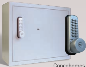
Concebemos estruturas específicas de guarda de chaves